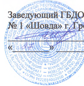
СХЕМА ОПОВЕЩЕНИЯ руководящего состава и работников ГБДОУ № 1 «Шовда» г. Грозный при возникновении чрезвычайных ситуаций (ЧС)